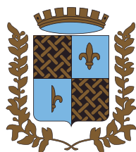
Ville de Tartas